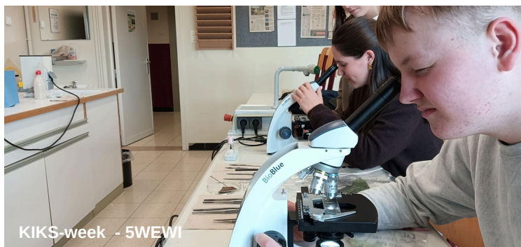
KIKS-week - 5WEWI