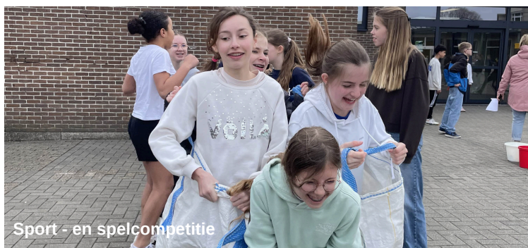
Sport - en spelcompetitie