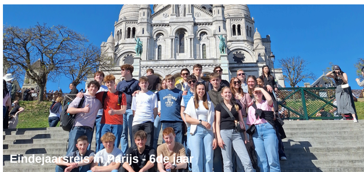
Eindejaarsreis in Parijs - 6de jaar