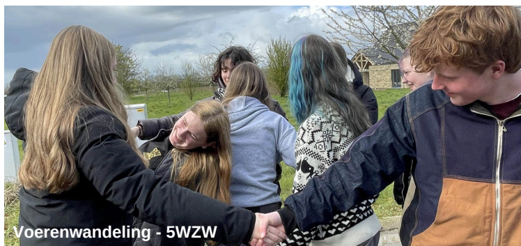
Voerenwandering - 5WZW