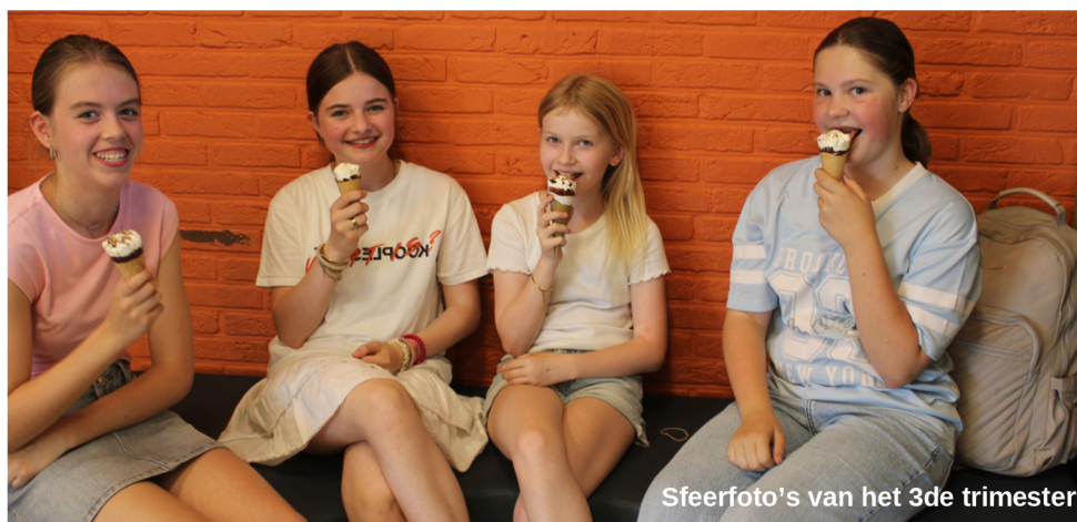
Sfeerfoto's van het 3de trimester